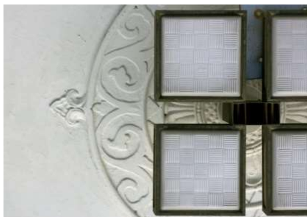
北館車寄せ天井中心飾り

施工は同誌に、「第一期工事請負者 市村市松/代理施工 清水組/第二期工事請負者市村市松/代理施工 上田眞次郎/大橋龍太郎」とあり、全工事を通じて市村市松が請負者であることが知られるが、どのような役割を果たしたかは不明で、『「回顧」創立六拾周年記念誌』(昭和 31 年(1956))の沿革概要の昭和 7 年の項に「九月二十日 本校改築第一期工事完成に付本日清水組及県との引継ぎ終了せり」とあることから、少なくとも一期工事については清水組が実際の施工を行ったと考えられる。