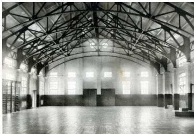
『改築落成記念』より体育館

設計者については『改築落成記念』(昭和 8 年(1933))に、「設計顧問 工学博士 笠原敏郎/設計 技師 寺師通尚/技手 岩崎平太郎」とある。笠原敏郎は当時、関東大震災後の東京の都市計画に携わり、帝都復興院建築部長を務めており、寺師通尚は、一時奈良県技師として赴任していたが、設計の実務は、岩崎平太郎が取り仕切ったとされている。岩崎は奈良県吉野郡下市町に生まれ、吉野実業学校(現奈良県立吉野高等学校)建築科卒業後、京都府の古社寺修復業務に携わり、武田五一の建築事務所・木圭社を拠点として活躍し、昭和 6 年(1931)、奈良県技手となり畝傍中学校の設計を担当した。それまでの経歴から和風を得意としたが、同時に鉄筋コンクリートの構造設計もできたとされている。