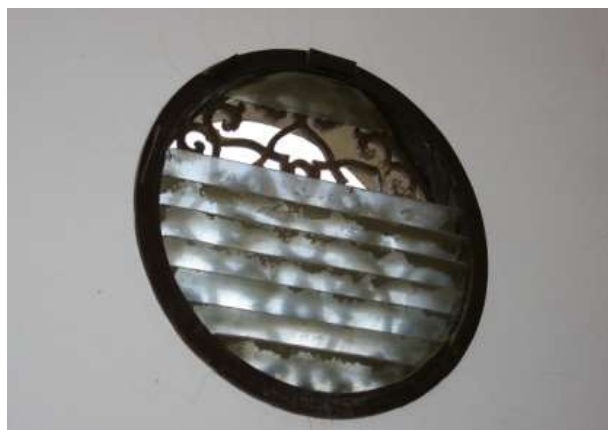
南館階段室上部のガラスガラリとグリル