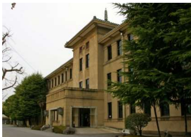
北館塔屋と車寄せ・玄関

当校は、明治29年(1896)3月13日付奈良県告示第101号をもって、奈良県尋常中学校畝傍分校として開校し、県下では五條分校(現奈良県立五條高等学校)と共に、郡山中学校(現奈良県立郡山高等学校)に次ぐ古い歴史を持つ。開校当初は晩成尋常高等小学校(現橿原市立晩成小学校、橿原市小房町所在)の一部を仮校舎としていたが、翌明治30年(1897)4月、八木町大字八木(現橿原市八木町1丁目、近畿日本鉄道八木西口駅東側)に新校舎を建設して移転し、明治32年(1899)4月1日付奈良県告示第66号をもって奈良県畝傍中学校として独立、明治34年(1901)には奈良県立畝傍中学校と改称した。