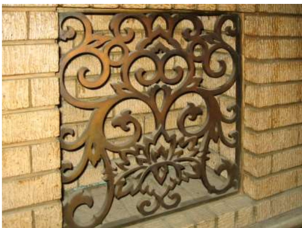
北館会議室暖炉グリル

当建物は洋風建築の構成を持ちながら、校舎の上部には仏塔風の塔屋を含む本瓦葺屋根を載せるほか、随所に和風の表現が見られる和洋折衷様式の建物である。建築家岩崎平太郎の代表作の一つであり、県下に現存する鉄筋コンクリート造校舎としては最古で、校長室に奉安庫が完全な形で残るなど竣工当初の姿を良く残しており貴重である。