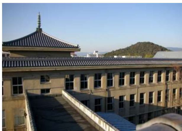
南館屋上から北館越しに見る耳成山

当校の敷地は東西約 260m、南北約 220mで、敷地西面やや南寄りに正門を開き、正門から東に中央通路を延ばして校地を南北にほぼ 2 分し、南側に校舎等の施設を配し、北側は敷地をやや低くして運動場とする。校舎は中央西寄りに北館、南館、渡り廊下からなる本館を配し、北館、南館の間に第一・第二倉庫、第三倉庫を配す。本館西側には文化創造館、第一、第二史料館が並び、本館東側に