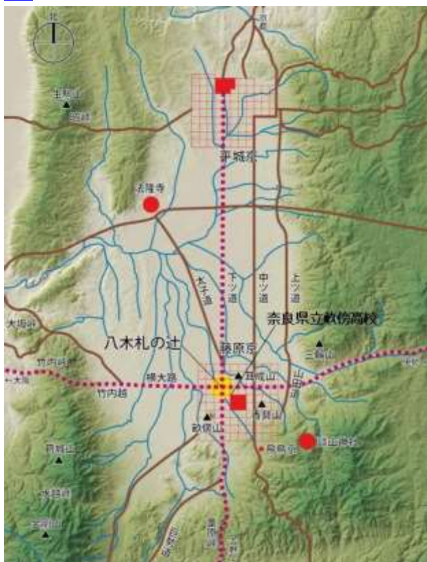
案内図（奈良盆地の古道と都城）

詳しくは、国指定文化財等データベース https://kunishitei.bunka.go.jp/bsys/index_pc.html より、検索の上ご覧ください。