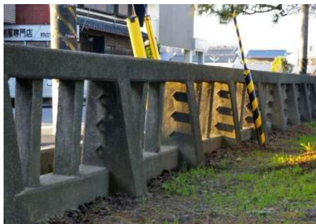
運動場側から見る西側柵（金属供出の跡が確認される）

当朝礼台は、昭和前期の固定式朝礼台として希少であり、運動場と中央通路の間の高低差を利用した観覧席を兼ねた階段の中央にあつて、運動場の中心を際立たせており、運動場の要として当校の重要な構成要素となっている。