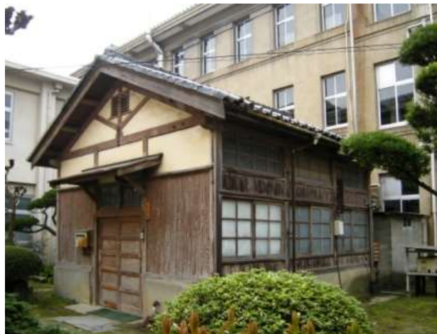
第三倉庫（旧動力庫）北西面

当建物は洋風建築の構成を持ちながら、校舎の上部には仏塔風の塔屋を含む本瓦葺屋根を載せるほか、随所に和風の表現が見られる和洋折衷様式の建物である。建築家岩崎平太郎の代表作の一つであり、県下に現存する鉄筋コンクリート造校舎としては最古で、校長室に奉安庫が完全な形で残るなど竣工当初の姿を良く残しており貴重である。