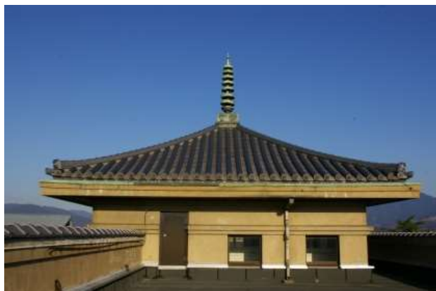
宝形造、相輪を載せた北館塔屋の屋根

所、動力室などの新築工事に着手、翌昭和 7 年(1932)9 月に竣工し、電灯設備未完工ながらも昭和 8 年(1933)1 月から授業が開始されている。第二期工事は同年 3 月着手で、講堂、武道場、銃器庫、物置、生徒便所などを建設し、同年 10 月に竣工して全館が完成し、10 月 27 日に落成式が行われた。