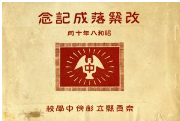
『改築落成記念』表紙

は、北館に並んで特別教室棟、南館に並んで新南館が配され、この間に小体育館を配している。これよりさらに西には部室、体育研究室を配し、西端にプール、格技場を設ける。中央通路、運動場間の段差には階段を設け、ほぼ中央に本館玄関と軸線を揃えて後壁付きの朝礼台を設ける。運動場は東端に体育館、弓道場を配し、弓道場北には同窓会館を配している。敷地西面は水路を挟んで道路に面し、正門に連続して切石積上に鉄筋コンクリート製の柵を設けている。