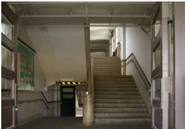
北館玄関から渡り廊下を見る

当時の写真から正門及び柵もすでに竣工していたことが知られるが、『改築落成記念』所収の写真では中央通路と運動場間の階段及び朝礼台は竣工していない。階段及び朝礼台の建設時期は明らかでないが、『「回顧」創立六拾周年記念誌』所収の体操風景の写真に朝礼台及び階段が写っており、「2600年」のキャプションから、少なくとも昭和15年(1940)には建設されていたと考えられる。