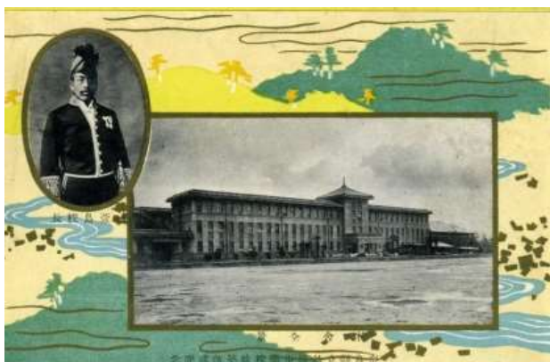
『改築落成記念』絵葉書部分