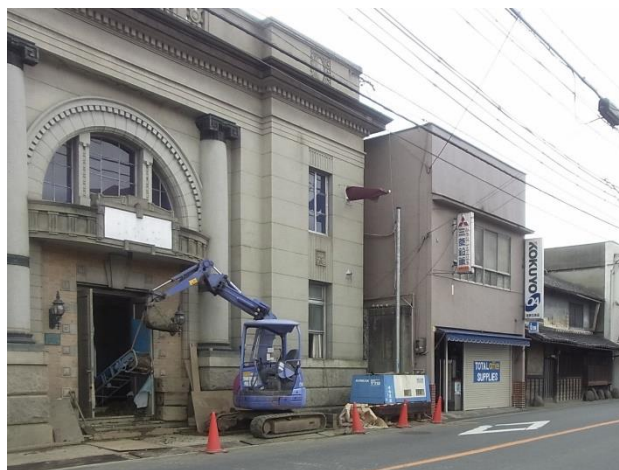
道路拡幅による曳き家工事

いっぽうで始まった道路の拡幅工事には、いきなり目の前で「風景革命」がおこるので、めんくります。ある日、作業服の測量隊があらわれ、引き上げたかと思うや数年後、突然道路沿いの建物の解体や曳き家が始まります。