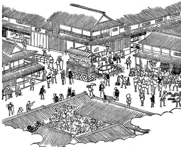
西国三十三所名所図会(嘉永6年)『八木札街』

思い出すと、小さいころは古めかしい屋敷の間を縫うように走る「路地」が絶好の遊び場でした。ぐいち（くい違い）をなす路地での鬼ごっこや缶蹴りはとてもスリリングでしたし、長細い町家の通り庭（家屋内を貫通する土間）までもが子供特権の公道となっていました。町内のそうした小路は子供らの頭の中に完全にマッピングされ、友人宅までの最短距離は当然のこと、どこにどんな怖いおじいさんが生息しているか、そこではどこまでの遊びが許されるかも熟知していたものです。