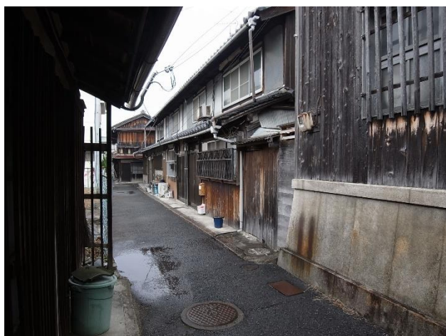
町家でのアート展示と細い路地

かれこれ十年近く無住のたたずまいを見せていた古い町家が、今や暖かい人の声が通りに聞こえるようなアットホームな店になっています。学業成果を地域に活かそうとの試みに、当初周囲の眼はいぶかしげでありましたが、やがてそれも当たり前の風景になり、見守るまでになりました。