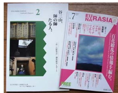
「奈良県立大学 ユーラシア研究センター情報誌「EURO-NARASIA Q」第7号に「幕末大和の大学者谷三山の足跡を追う」、NARA-EURASIA Institute's Report「谷三山師の師たる人。」