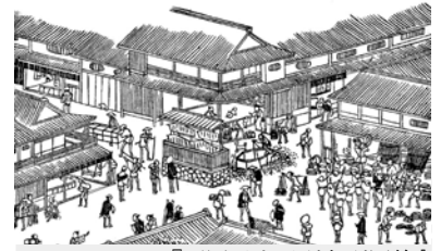
『西国三十三所名所図絵』

わが国は通商条約を締結した翌年から、外国と貿易を開始するようになります。これに伴って外国から安い綿製品が国内市場へどっと入りこんでくるようになりました。そうすると、綿をつくり、糸を紡ぎ、織るという仕事に従事していた人たちの生活が非常に苦しくなりました。さらに米穀の値段がぐっとあがり、世の中に困窮した人たちが満ちあふれるような状況になりました。そういう状況の中で三山は、「攘夷」ということを強く主張するようになりました。困窮している人たちの生活を改善するためには攘夷が不可欠であると、庶民生活に目を向けるなかで考え