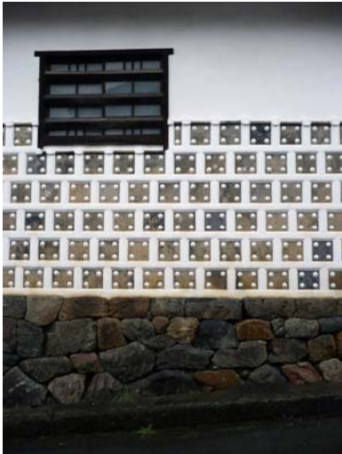
高取町にある植村家長屋門 (奈良県指定文化財)