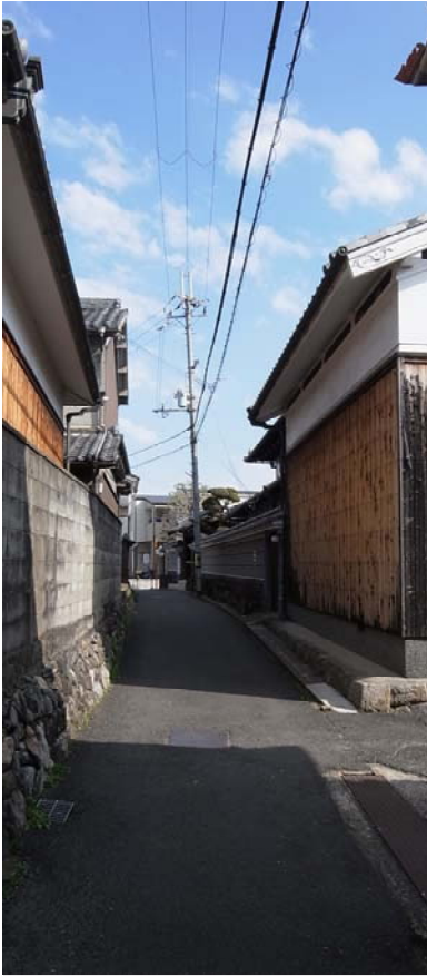
榎原市石川町の町並み

大村益次郎【おおむらますじろう】 1825-1869 幕末の兵法家。周防の人。戊辰戦争ですぐれた軍事指揮を執った。日本の兵制の近代化に尽力したが、反対派浪士に襲われて死亡。