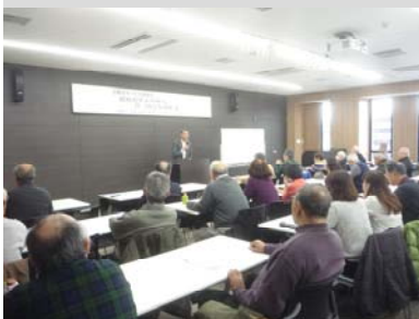
ミグランスでの講演会の様子

1853(嘉永6) ペリー来航 1854(嘉永7) 日米和親条約締結 1854(安政元) 日露和親条約調印 1856(安政3) ハリス来日 1857(安政4) 松下村塾開塾 1858(安政5) 日米修好通商条約調印、安政の大獄 1860(安政7) 桜田門外の変 1862(文久2) 生麦事件 1863(文久3) 薩英戦争 1864(元治元) 池田屋事件 1866(慶応2) 薩長同盟 1867(慶応3) 王政復古の大号令、谷三山没 1868(慶応4) 鳥羽・伏見の戦い、戊辰戦争、年号明治 1869(明治2) 東京遷都、版籍奉還 1871(明治4) 廃藩置県 1872(明治5) 学制公布、富岡製糸場設置 1873(明治6) 徴兵令、地租改正 1874(明治7) 民撰議院設立の建白 1875(明治8) 樺太・千島交換条約締結 1876(明治9) 廃刀令 1877(明治10) 西南戦争 1881(明治14) 国会開設の詔 1885(明治18) 内閣制度 1889(明治22) 大日本帝国憲法 1890(明治23) 第一回衆議院議員総選挙、第一回帝国議会 1894(明治27) 日英通商航海条約調印 1895(明治28) 石河正竜没