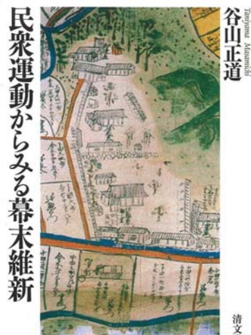
『民衆運動からみる幕末維新』

主な著書に、『近世民衆運動の展開』(高科書店、1994年)、『民衆運動からみる幕末維新』(清文堂出版、2017年)などがある。博士(文学)。