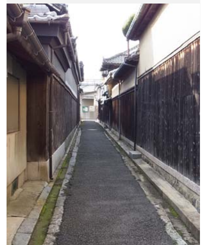
谷家南側路地 西を見る

1757-1827 江戸後期の蘭学者。陸奥の人。杉田玄白・前野良沢にオランダ医学とオランダ語を学び、長崎に遊学。著「蘭学階梯」「重訂解体新書」など。