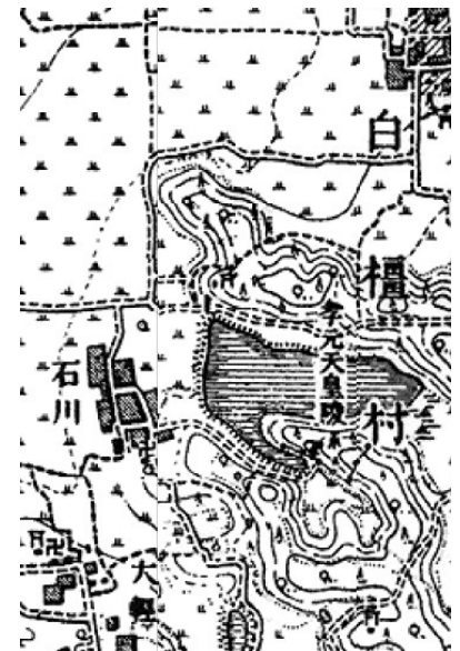
明治41年測図 石川村 今昔マップ on the web

どういうことかといえば、この頃は、国内情勢が非常に不安定で、外国との関係においても薩英戦争などが起き、それまでだと大坂から瀬戸内海を経由して米とかが薩摩へもたらされていましたが、瀬戸内海で