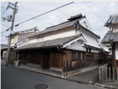
檀原市八木町にある谷三山生家

江戸時代中期から幕末にかけて、オランダ語、およびオランダ語を通して行われた西欧諸科学、技術および西欧事情の学習研究とその知識をいう。