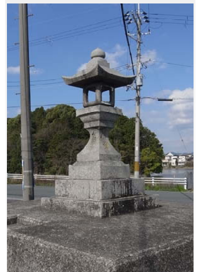
橿原市石川町の太神宮灯籠(天保11年)