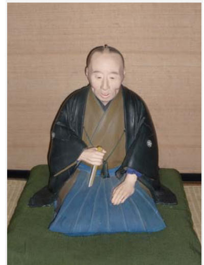
谷家蔵 谷三山木像

「たとえ通好を許されることになっても、兵備を整えていくことは必要であり、拒絶される場合には、海辺は言うまでもなく内地においても、しっかりとした防御の策を講じ、精兵を的確に配置して要所を固めなければならない」また「現時点での通好には反対だが、西洋の学問に目を向けて優れたところを学び、積極的に活用して国力の充実をはかるべきである」と述べられています。特に注目したのは、後者の方です。