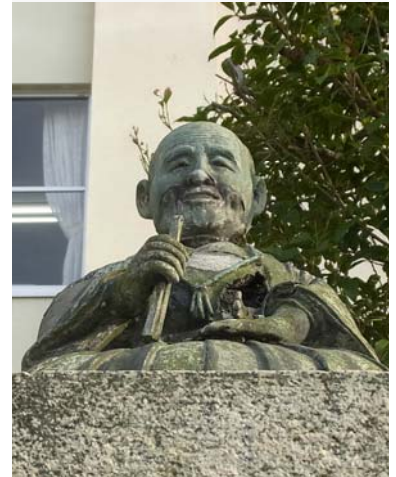
晩成小学校にある「谷三山」座像