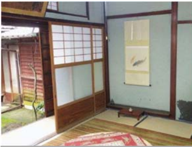
「相在室」の扁額のある部屋