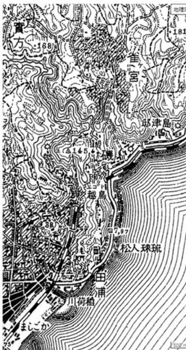
明治42年測図の鹿児島島の磯 今昔マップ on the web